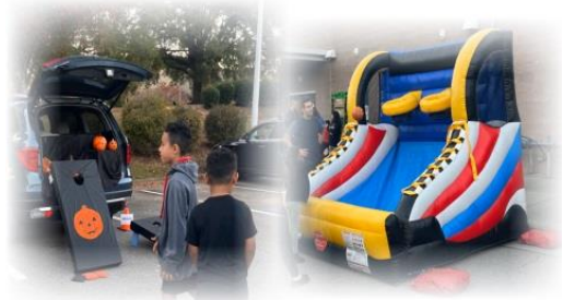
Fall Festival 2023